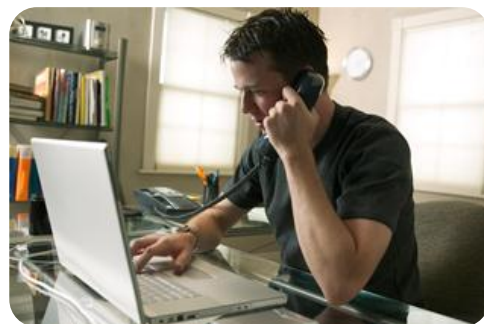
Пользуйтесь услугой по обмену картриджами от Xerox из любой точки мира